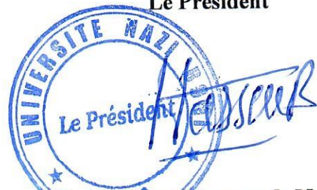
Pr Hassan Bismarck NACRO Officier de l'Ordre des Palmes académiques